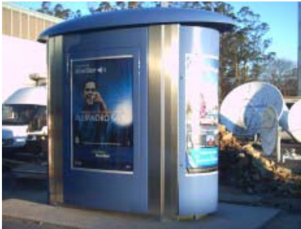
Sus diseños se mimetizan en el entorno y son de reducida dimensión.